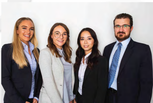
Team Linz der Poduschka Anwaltsgesellschaft

Untenstehend werden Sie direkt zu unseren sozialen Medien weitergeleitet.